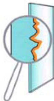
ClearShield beschermt langdurig

C learShield gaat met het glasoppervlak een sterke chemische verbinding aan en wordt een vast bestanddeel van het glasoppervlak. ClearShield volgt de contouren van het glas en is kleiner dan een micron dun. Belangrijk is, dat ClearShield zich alléén met glas of glasachtige oppervlakken verbindt. Met andere oppervlakken gaat ClearShield geen verbinding aan en kan hiervan met warm water worden afgewassen.